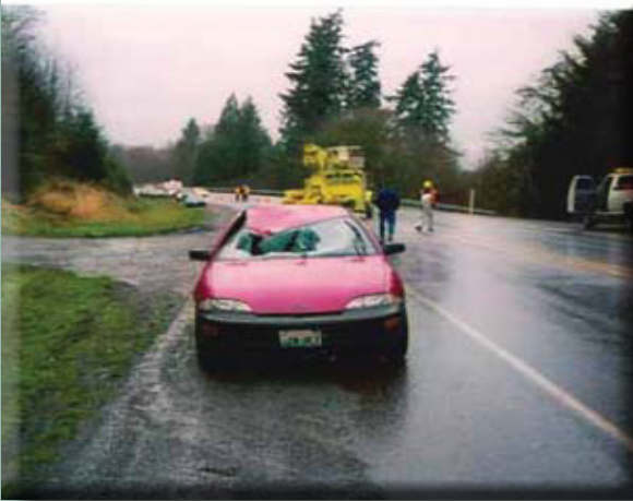
El vehículo involucrado en el incidente mirando hacia el oeste sobre la rampa del carril con dirección al este.

ARTBA American Road & Transportation Builders Association