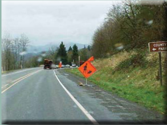
Señales de la obra con dirección al este hacia la zona del incidente, el cual se encuentra justo a la vuelta de la curva en la carretera.